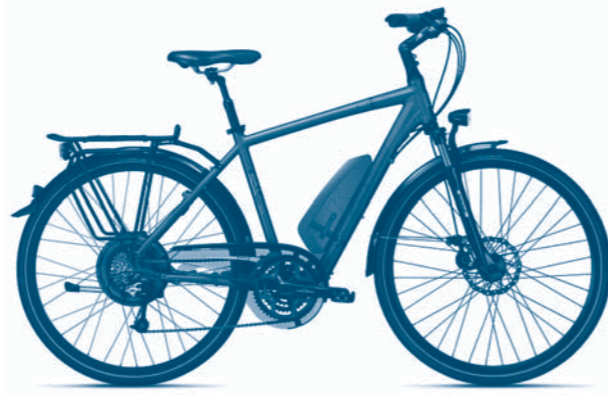
KRAFTVOLLER ANTRIEB, HOCHWERTIGE AUSSTATTUNG: DAS KALKHOFF PEDELEC IMAGE B 27

Den gleichen leistungsstarken Motor hat auch das Modell Image B 24 , mit einer 24-Gang-Deore Schaltung, hydraulischen Felgenbremsen und einem komfortablen einstellbaren Concept UP-Vorbau. 800 g schwerer, 300 Euro günstiger. 1.999 Euro