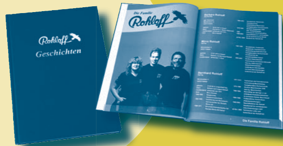
DIE ROHLOFFS – EINE ERFOLGSGESCHICHTE.

bung der wenn auch schwierigen so doch erfolgreichen Entwicklung der Firma Rohloff und einigen Seiten « facts » von der technischen Sorte kommen die Kilometerkönige unter den Kunden zu Wort mit ihren schönsten, skurrilsten, unglaublichsten Fan-Geschichten. Ein ideales Geschenk für alle Rohloff-Enthusiasten. 256 Seiten. Hardcover. 1,3 kg . 15 Euro.